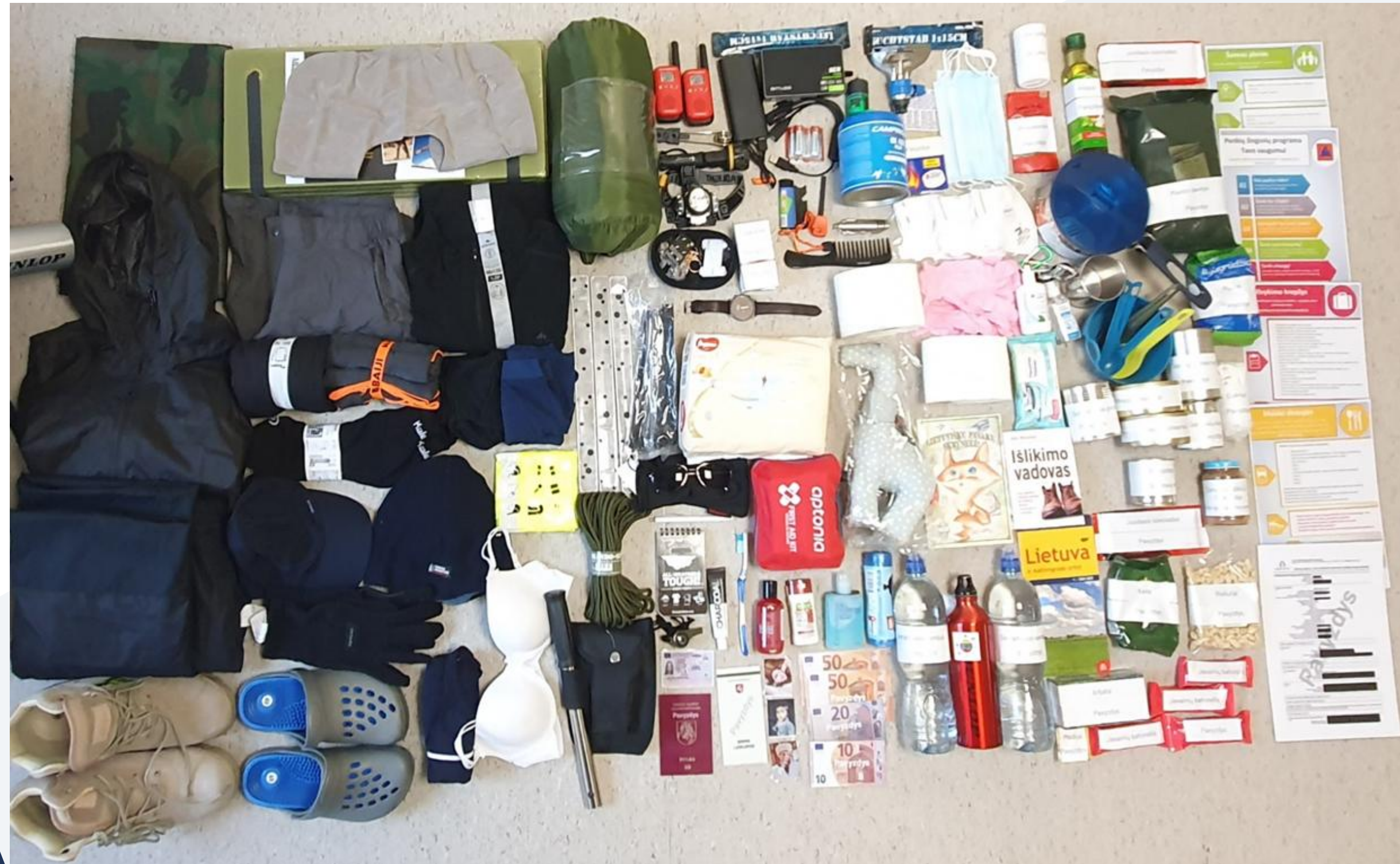
Nuoroda į išvykimo krepšį